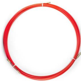
Рис. 5: Кондуктор для протяжки кабеля

отсутствие достаточно большого свободного пространства в кабель каналах между этажами (особенно проблемным участком являлся кабель канал между 4 и 3 этажами, из-за необходимости протягивания через него сразу 3 кабелей). Если остальные проблемы сделали прокладку кабельной линии более трудоемкой, то для решения проблемы с недостатком пространства был применен специальный инструмент для протяжки кабелей - кондуктор (пример данного инструмента приведен на рисунке 5).