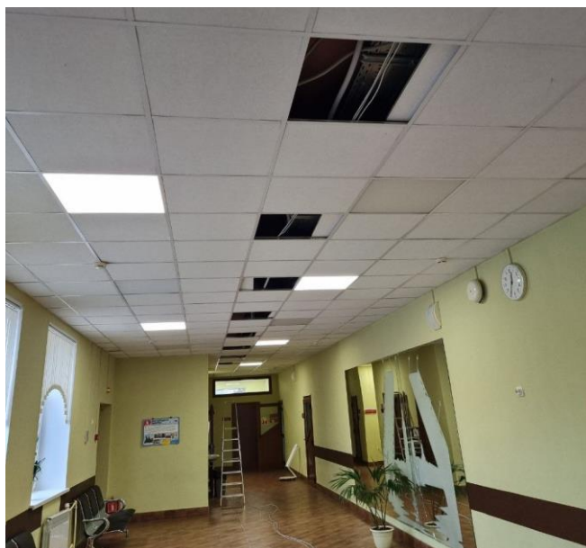
Рис. 3: Прокладка кабеля на 4 этаже