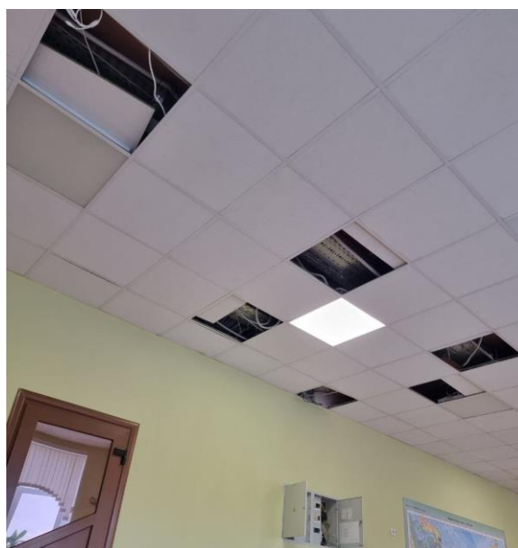
Рис. 4: Ранее проложенные кабели

Возникновение данных проблем существенно осложнило и замедлило процесс прокладки кабеля, особенно неприятной проблемой стало