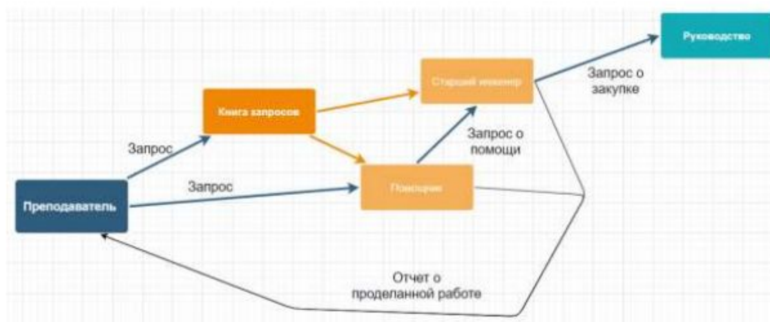
Рисунок - Алгоритм обработки и выполнения заказа

Механизм организационной деятельности – каждый берет часть работы, заранее описанной в книге заказов или обговоренной в устной форме, если помощник не может выполнить задачу он обращается к старшему. Если задача не выполнима, то вопрос решается с директором.