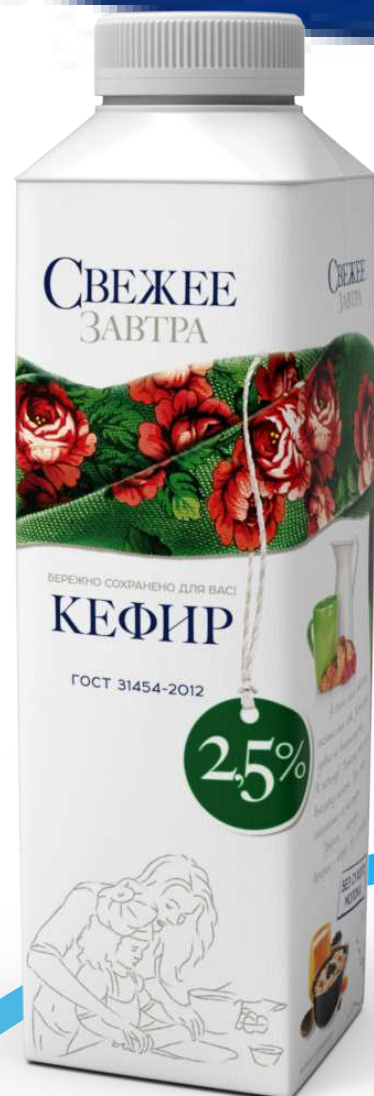
КЕФИР Объем: 0.5 л