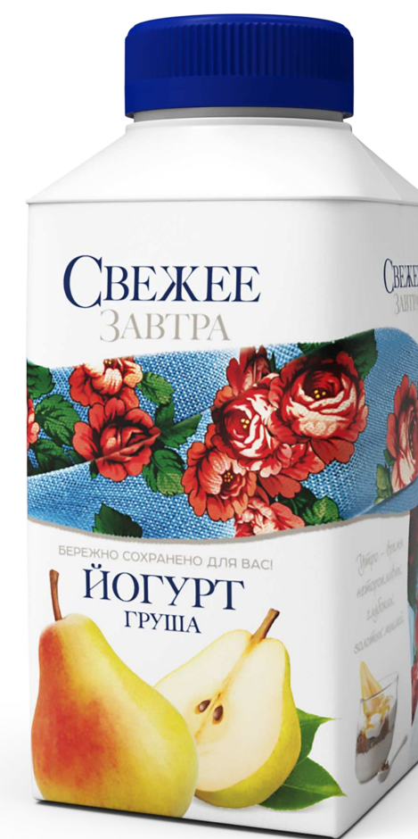
ЙОГУРТ Вкусы: груша/черника/ малина/клубника