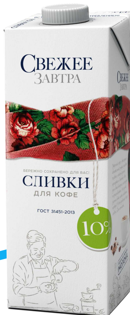
СЛИВКИ Объем: 0.5 л 10%/25%/34%