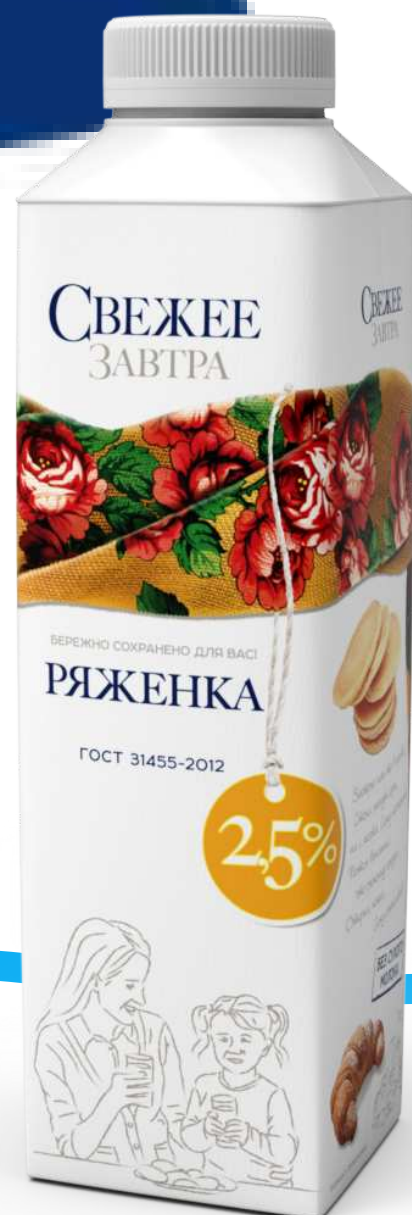
РЯЖЕНКА Объем: 0.5 л